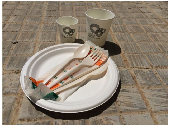
Kit de couverts en matériaux biodégradables distribués aux acteurs touristiques