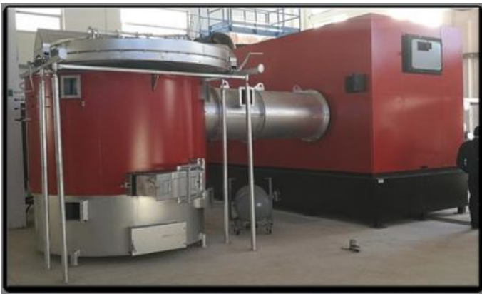
Centrale à Torre Nova en Sicile : 2,5 MW, ORC de 200 KWE, démarrée en mars 2017