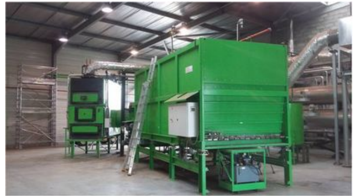
Démonstrateur à Hyères : 750 kW, ORC de 40 KWE, démarré en février 2016