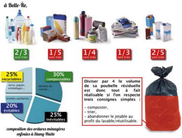
Composition des ordures ménagères enfouies à Stang-Huète