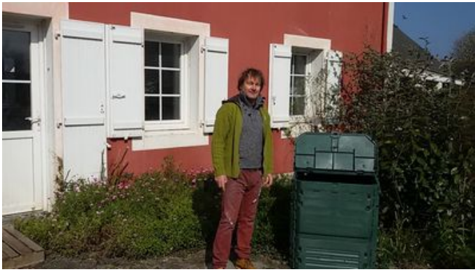
Composteur individuel à Belle-Ile