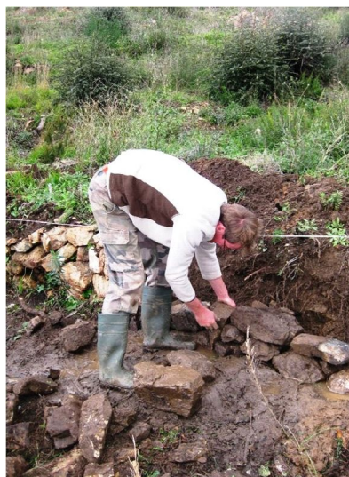
Etape de parement