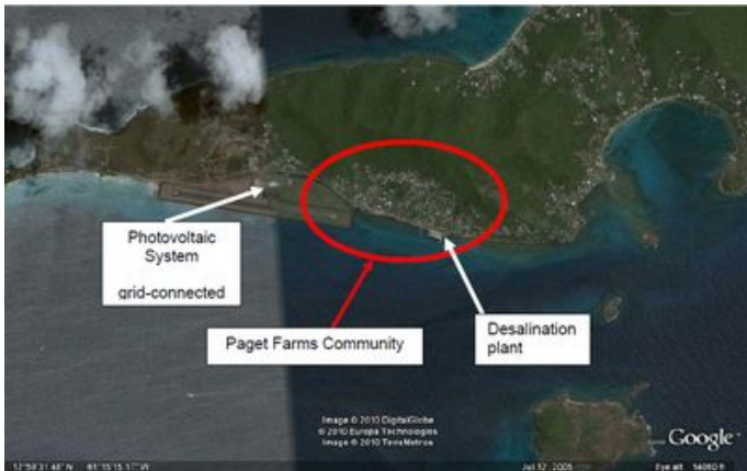
Vue aérienne de la communauté de Paget Farms montrant approximativement les emplacements de l'usine