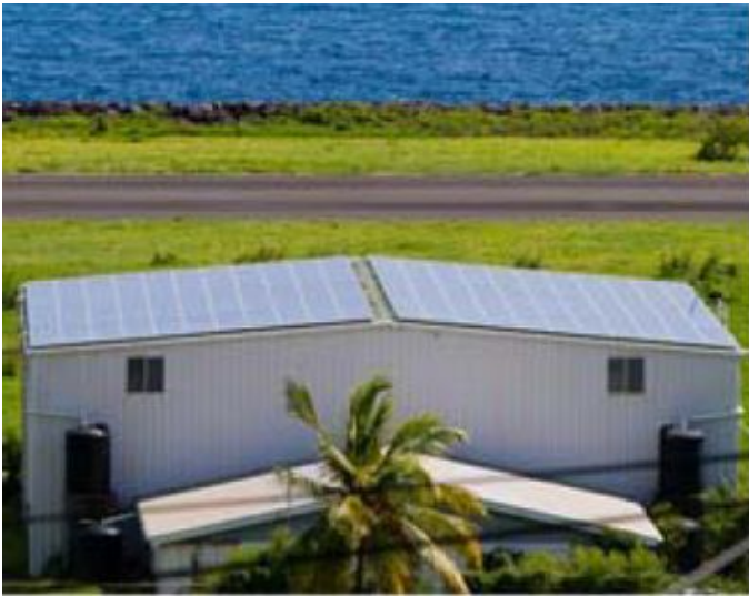
Hangar de l'aéroport de Bequia avec les panneaux photovoltaïques installés sur le toit.