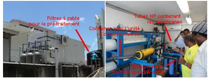
Vue extérieure et intérieure de l'unité de dessalement à Bequia