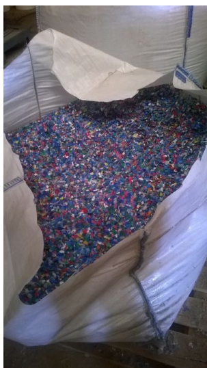
Mélange de copeaux en plastiques broyés chez MP Industries