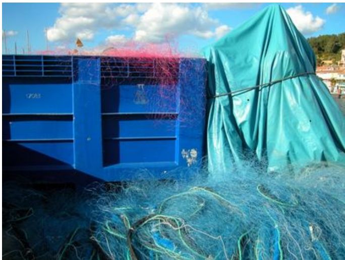
Filets de pêche stockés en plein air à St Mandrier