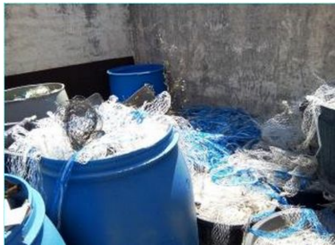
Pochons à moules de Port-Saint-Louis destinés au recyclage chez MP Industries