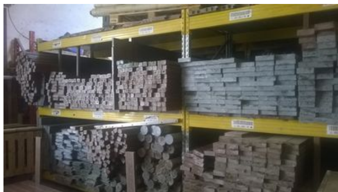
Planches de plastique recyclées produites à MP Industries