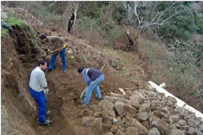
Etapes de déblayage et de fondations