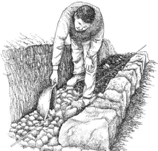
Etape de lit d'assise