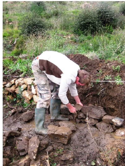
Etape de parement