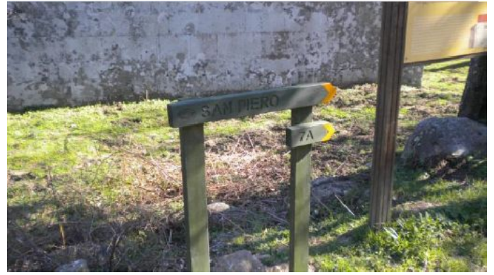
Sentiers dans le Parc National de l'Archipel Toscan