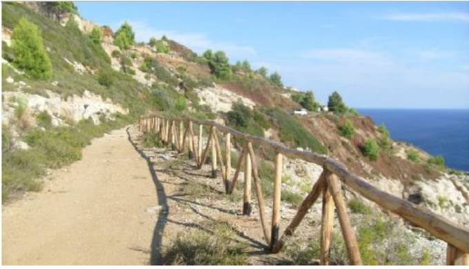
Sentiers dans le Parc National de l'Archipel Toscan