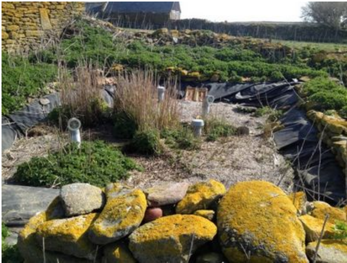
1er étage des filtres plantés aux Marais du Vigueirat